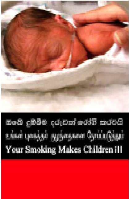
I වැනි වර්ගය